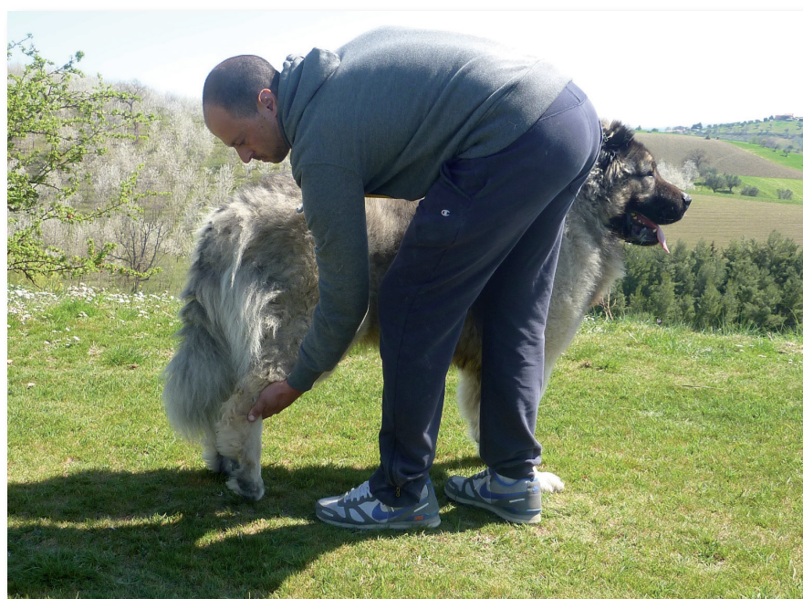
Foto n. 3 - posizionamento posteriore interno

se giro il manubrio per girare a destra mi si libera il peso