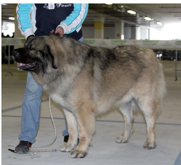
Riserva CACIB Pastore del Caucaso: Dako del Partenio