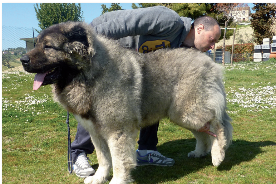
Foto n. 5 - posizionamento posteriore esterno

zioni che vanno sempre fatte e riguardano il giusto posizionamento della coda e della testa del cane. Queste ultime sono importantissime perché danno espressione al cane, per fare in modo che le tenga nella giusta posizione, nel caso in cui non abbia da sé un giusto atteggiamento, ci si può aiutare attirando l'attenzione del cane con dei bocconcini. Nei casi in cui il cane non è interessato al cibo bisogna aiutarsi con il guinzaglio