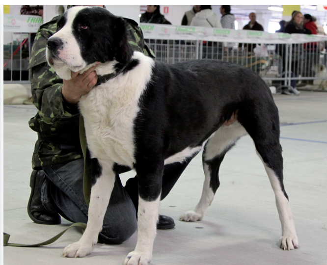
Ris. CAC Pastore dell'Asia Centrale: Simba