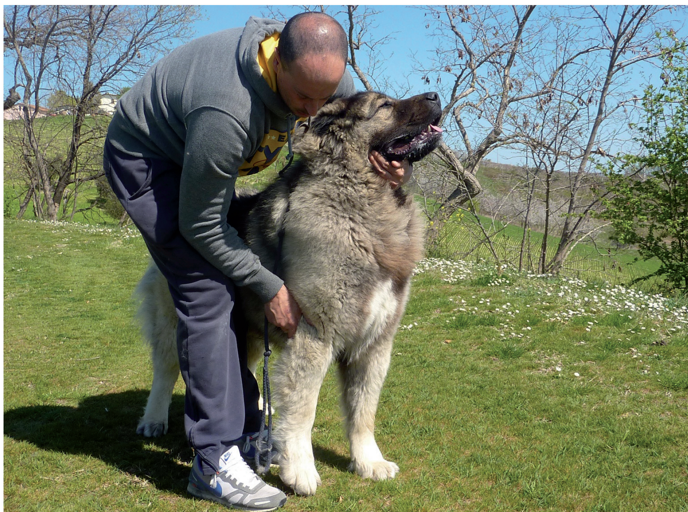
Foto n. 1 - posizionamento anteriore interno

Si comincia con il posizionare la zampa interna del cane, quella verso di noi e che pos-