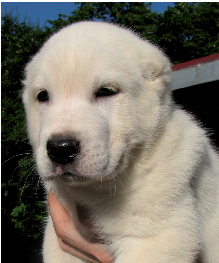
cucciolo da Grai Vest LUBIM - Ak Nukker FENECHKA

certamente ottenere il titolo di Campione di Club in Russia al prestigioso e competitivo raduno "Kubok Moscow", anche il risultato di 2 in Classe Campioni ottenuto da un soggetto da me prodotto all'Azat, la più prestigiosa expo per questa razza. E a questi si aggiungono diversi campionati di club in Europa. Oltre ai risultati di razza ho avuto innumerevoli riconoscimenti nel ring d'onore vincendo svariati raggruppamenti e ricordo su tutti i BIS a Belgrado e Skopije.