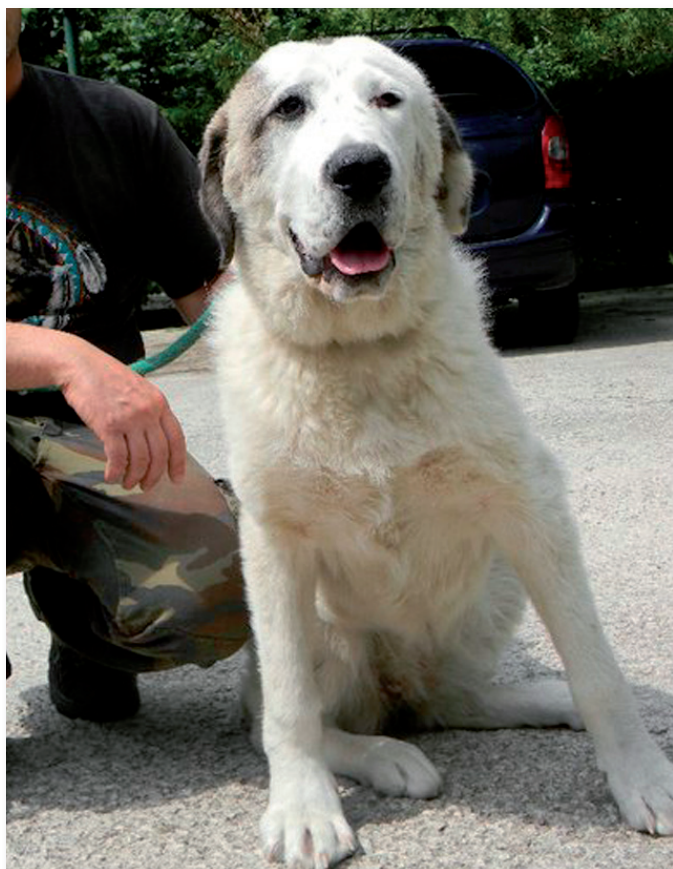
Soggetto dell'allevamento Killerwolf