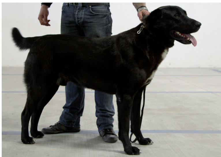
Riserva CAC Pastore dell'Asia Centrale: Shaytan