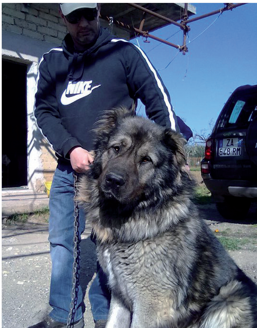
Soggetto dell'allevamento Killerwolf