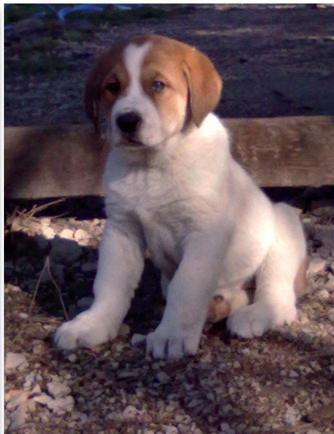
Soggetto dell'allevamento Killerwolf