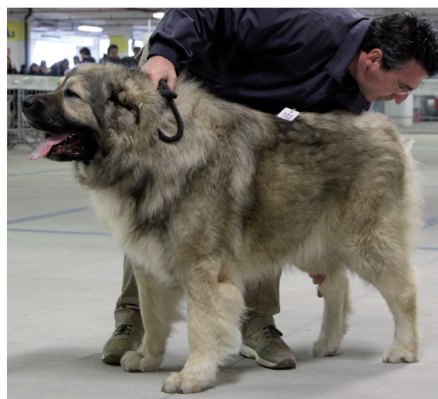
Miglior Maschio Pastore del Caucaso: Eryan Ksyezyc Pamiru

si è svolta nella massima serenità e grazie alla folta cornice a bordo ring anche con una certa tensione competitiva. 25 i soggetti iscritti per quanto riguarda il Cane da pastore del Caucaso, e i protagonisti del Raduno del 2011 si presentano all'appello e conquistano i medesimi risultati: Eryan Ksyezyc Pamiru (Kavkazskoy Natsionalnosty Nurbay x Adhara