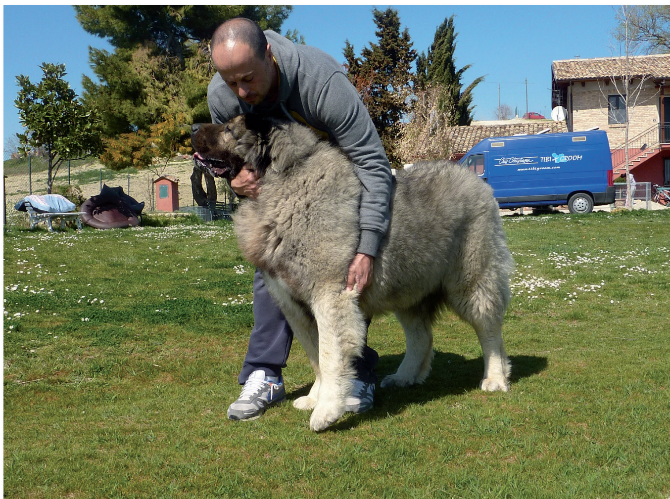
Foto n. 2 - posizionamento anteriore esterno

siamo vedere meglio. Per spostare gli arti anteriori del cane, il modo più corretto è quello di ruotare la testa del cane dalla parte opposta all'arto che dobbiamo spostare in modo da alleggerire l'arto stesso. Praticamente se dobbiamo spostare la zampa anteriore destra faremo girare il cane verso sinistra in modo che il peso del corpo non gravi sulla spalla destra (Foto 1). Naturalmente se dovrò spostare la zampa anteriore sinistra farò ruotare la testa del mio cane a destra in modo da liberare dal peso la spalla sinistra (Foto 2). Per rendere più comprensibile questo concetto pensate di muovere la te-