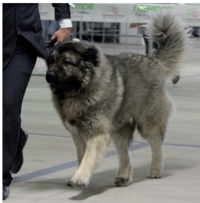
Baskoy Zver Ezhik Grey