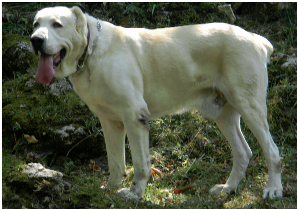
Soggetto dell'allevamento Killerwolf

sia alla difesa, ma allo stesso tempo docilissimi e affettuosi in famiglia e, specialmente, con i bambini.