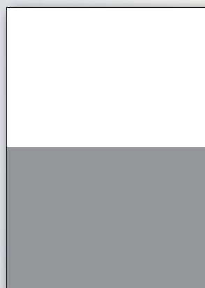
1/2 Pagina (solo interne)