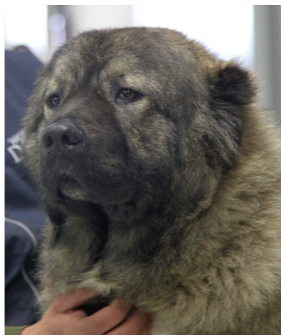
Miglior Giovane Pastore del Caucaso: Zatara