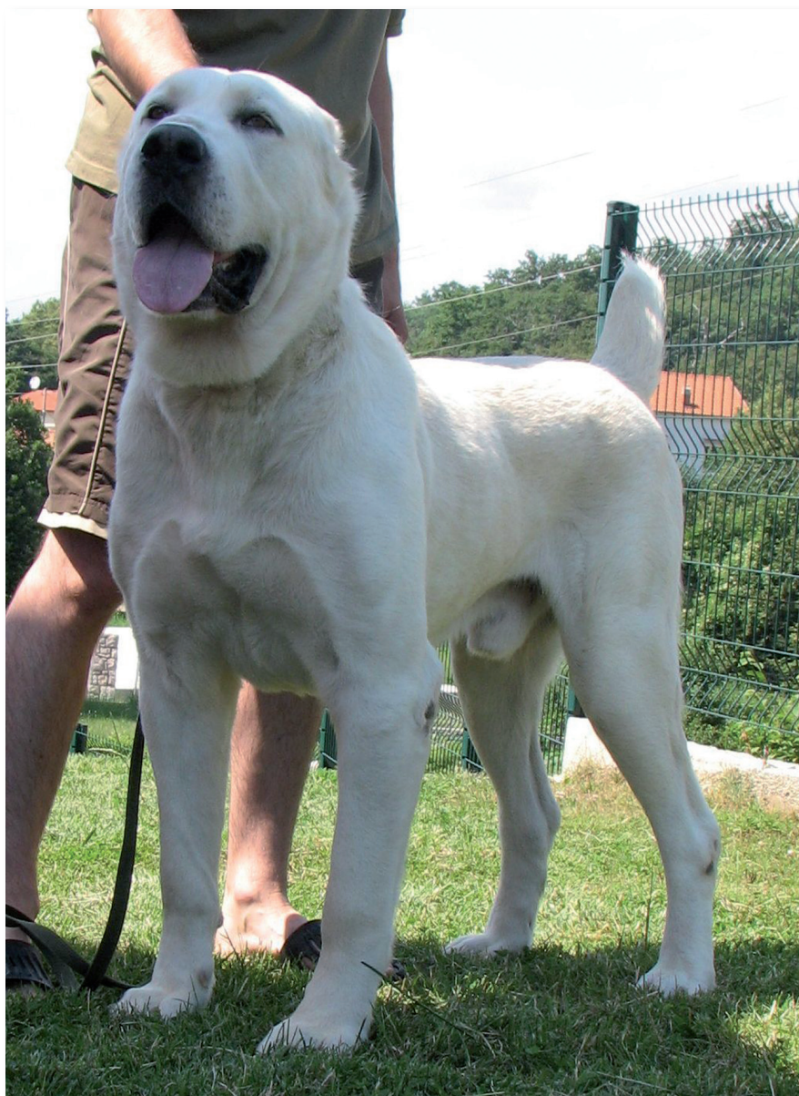
Gray Vest LUBIM