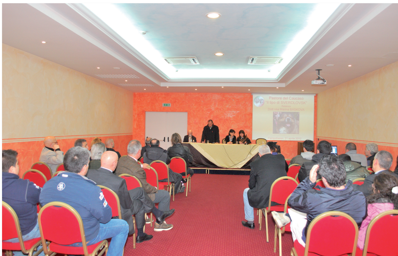
La platea della conferenza mentre prende la parola il presidente del Gruppo Cinofilo Molisano

mini di linee di sangue e i dettagli che ne caratterizzano la morfologia, soprattutto nei particolari della testa.