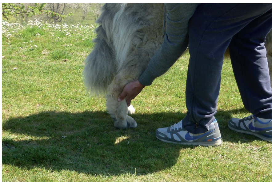
Foto n. 4 - posizionamento posteriore interno