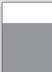
2/3 Pagina orizzontale