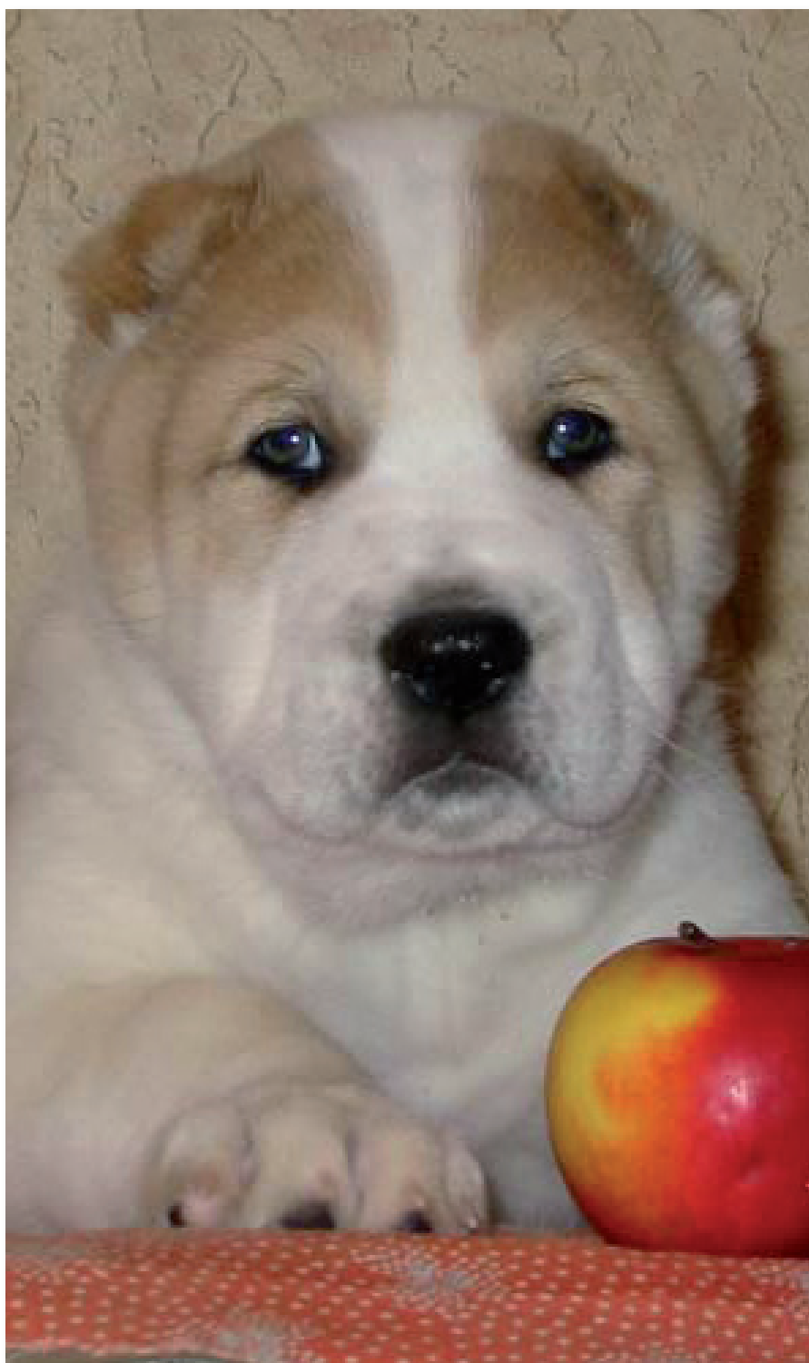
Soggetto dell'allevamento Killerwolf

Attualmente il mio allevamento è costituito da circa