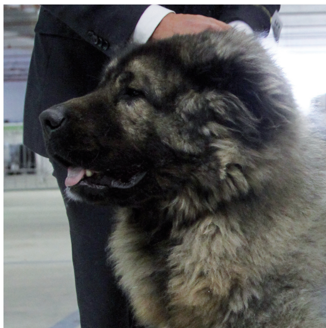
Baskoy Zver Ezhik Grey

Di seguito alcuni scatti del soggetto nella fase di giudizio e in copertina della rivista il podio del Best in Show.