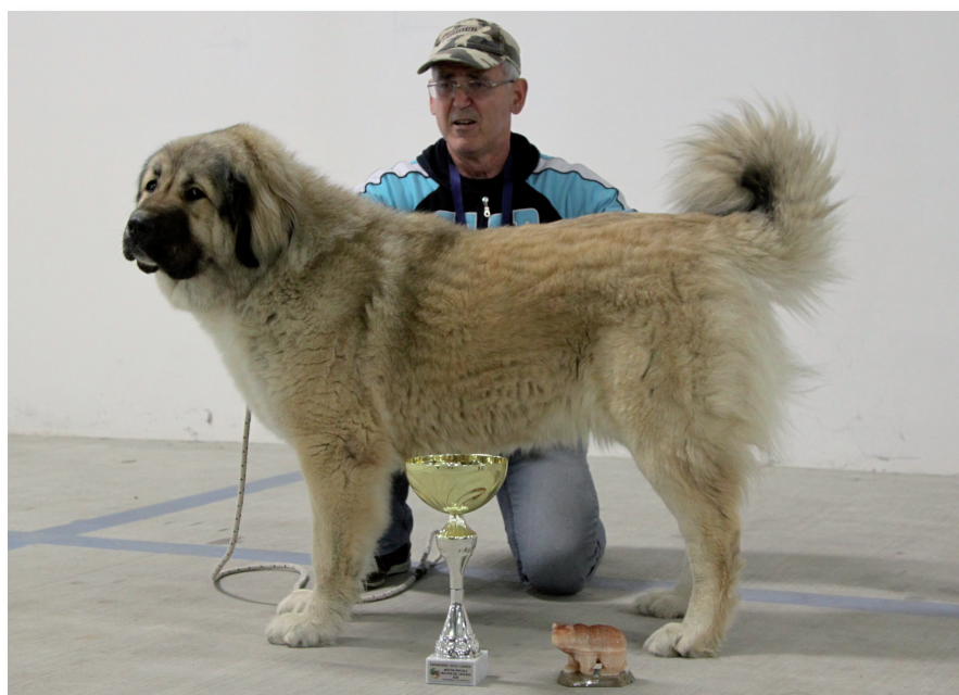
Migliore di Razza Pastore del Caucaso: Dia del Partenio

La Domenica mattina si apre lo scenario della 5 a Mostra Speciale organizzata dall'Associazione Italiana Pastori Russi in collaborazione con il Gruppo Cinofilo Molisano. Grande attesa per questo evento, che come anticipato ha riscosso una grande partecipazione di pubblico oltre che di appassionati espositori ed allevatori. La mostra giudicata da Svetlana Poryadina, esperta di massimo livello soprattutto per il Pastore del Caucaso,