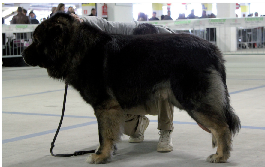
Riserva CAC Pastore del Caucaso: Kaluga Csillaga Bruno

si è svolta nella massima serenità e grazie alla folta cornice a bordo ring anche con una certa tensione competitiva. 25 i soggetti iscritti per quanto riguarda il Cane da pastore del Caucaso, e i protagonisti del Raduno del 2011 si presentano all'appello e conquistano i medesimi risultati: Eryan Ksyezyc Pamiru (Kavkazskoy Natsionalnosty Nurbay x Adhara