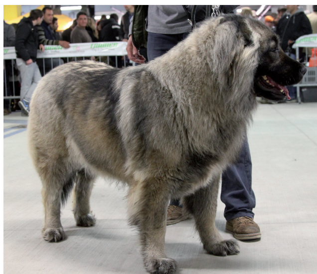
Riserva CACIB Pastore del Caucaso: Dikaya Staya Volya