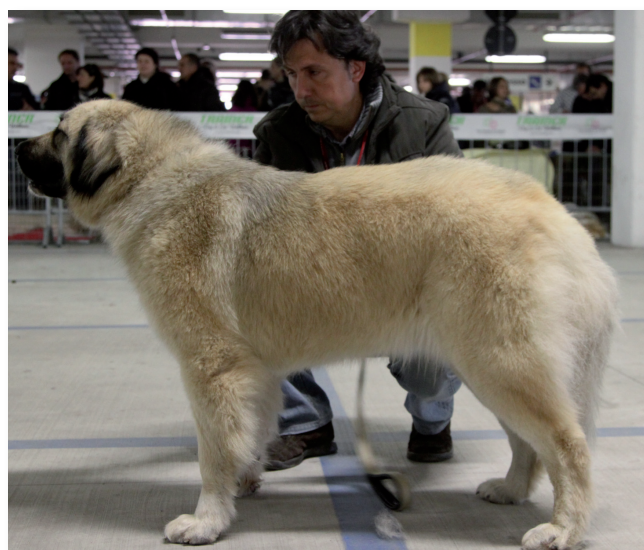
Riserva CAC Pastore del Caucaso: Cora del Partenio