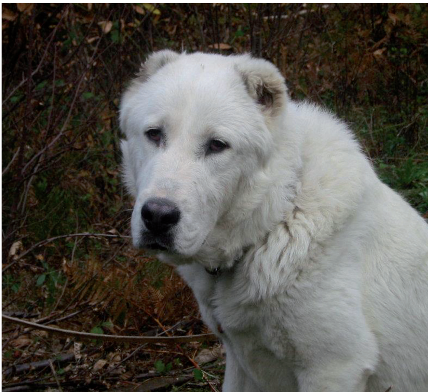
Soggetto dell'allevamento Killerwolf

15 pastori dell'Asia Centrale ed 8 pastori del Caucaso. Per quanto riguarda il PAC sto cercando di seguire la linea di sangue del grande Adzar di Tamerlano, un cane che ha dato tanto alla razza in Italia, e di Aziza Baronas, una cagna che mi dà grandissime soddisfazioni.