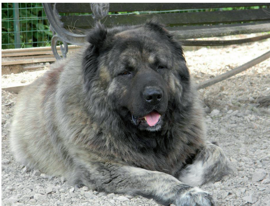
Soggetto dell'allevamento Killerwolf

Sinceramente non amo molto questi nuovi soggetti importati dalle terre d'origine: li reputo troppo esili, anche nella struttura della testa,