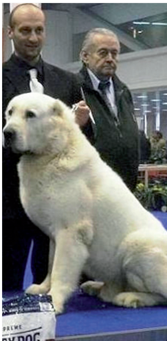
Ursa El Vager

cani per escludere patologie gravi ed ereditarie, inoltre in fase di selezione andrebbe data grande importanza alla scelta del giusto riproduttore per le proprie femmine, non accontentandosi dei cani che si hanno, o sono vicini, ma impegnandosi ad utilizzare il meglio anche se questo risulta complicato e oneroso, e soprattutto di porre grande attenzione alle femmine che si tengono in allevamento poiché nella selezione la qualità morfo-genetica delle femmine è prioritaria.