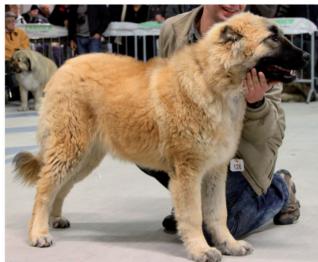
Miglior Juniores Pastore del Caucaso: Ester

Veniamo alle femmine dunque, dove come anticipato a vincere CAC, CACIB E BOB è Dia del Partenio. La Riserva CACIB va invece a Dikaya Staya Volya (Russky Risk